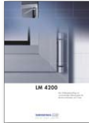
LM 4200 Der Drehkippschlag mit vormontiertem Klemmsystem für Aluminium-Fenster und -Türen