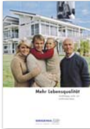
Mehr Lebensqualität Unabhängig, sicher und komfortabel leben