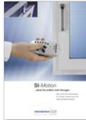
Si-Motion Damit Sie einfach mehr bewegen